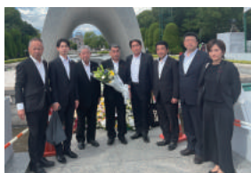
8月6日広島市の平和祈念式典へ長崎市議団として参列