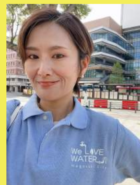
▲長崎市上下水道局の職員 ポロシャツ